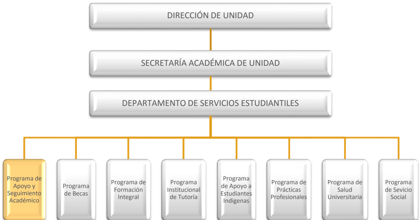
Diagrama 1. Organigrama de la unidad para el Departamento de Servicios Estudiantiles.

De esta manera, el PASA realizará sus actividades representado en cada unidad por un Responsable del Programa, el cual será quien desarrolle diversas funciones para el buen funcionamiento del mismo, así mismo, fungirá labores de coordinación para las actividades que realicen los docentes asesores (Docentes Guías) y los alumnos asesores (Guías UES).